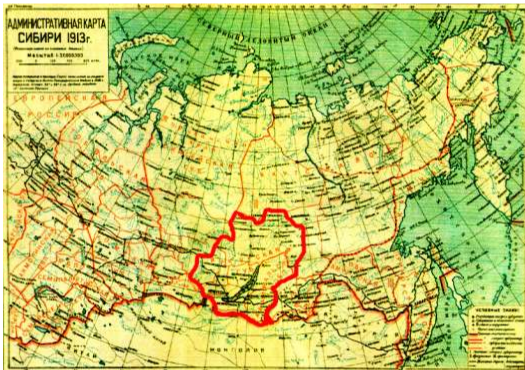
Рис. 3. Иркутская губерния

При всех преобразованиях практически неизменными оставались уезды — Иркутский, Тулунский, Киренский, что свидетельствовало о прочности сложившихся экономических связей, отражающих хозяйственную целостность данной территории. С учетом этих связей в сентябре 1937 года образована Ир-