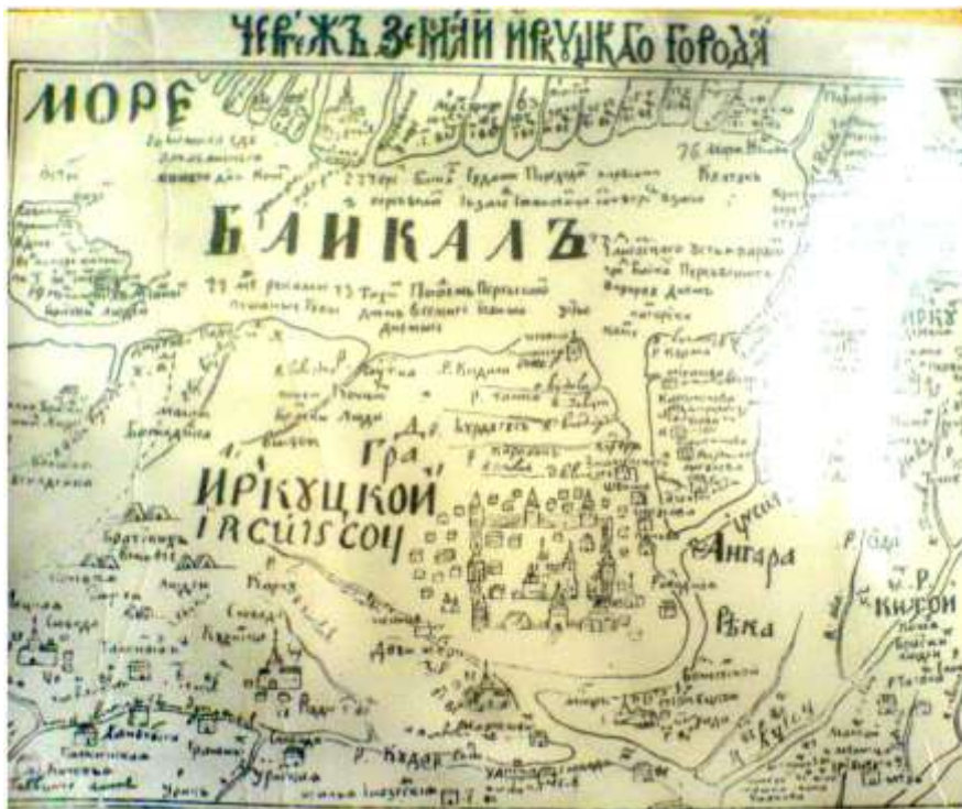
Рис. 1. Первая карта Иркутска и его окрестностей

мы даже не догадывались. Этот вопрос меня заинтересовал в начале года, когда началась подготовка к Юбилею города, я много слышала о культуре Иркутска, о первопроходцах, о реформах, но какая была территория Иркутска во все эти времена в учебниках так и не нашла.