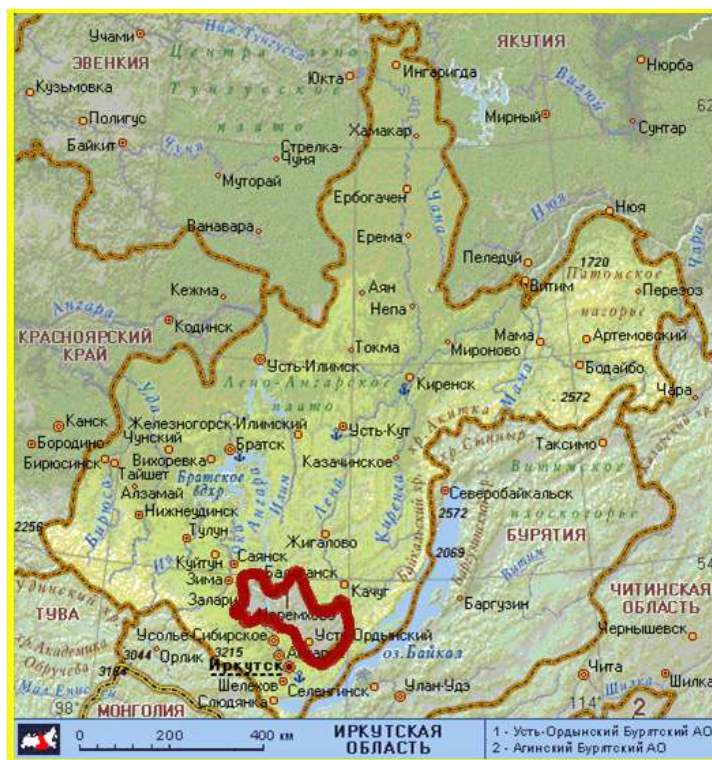
Рис. 4. Иркутская область

Определенные в 1937 году границы Иркутской области с незначительными изменениями на северо-востоке сохранились до нашего времени, хотя внутреннее деление административных районов за этот период менялось неоднократно.