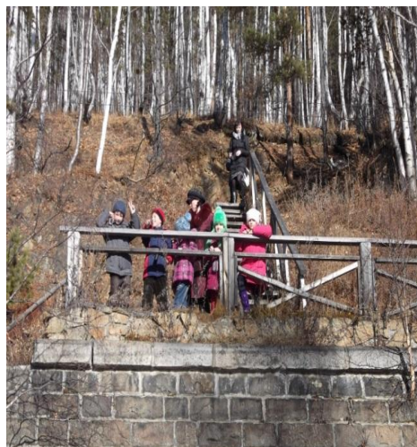
Рис. 4. Где хранилась вода для паровозов

ты, побывать в прекрасных местах. И конечно, испытать себя, ведь каждый поход — это испытание на мужество, выносливость и смекалку.