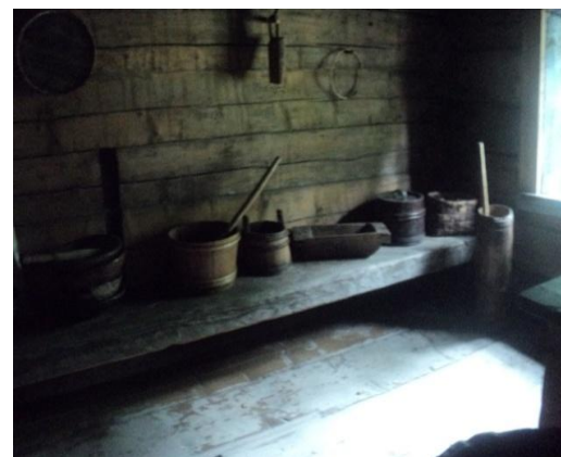
Рис. 1. Изба и посуда староверцев

Клуб «Любителей природы» объединяет в себе перспективные направления, позволяющие сформировать любовь к родному краю, бережное отношение к природе и выбор дальнейшего пути в жизни.