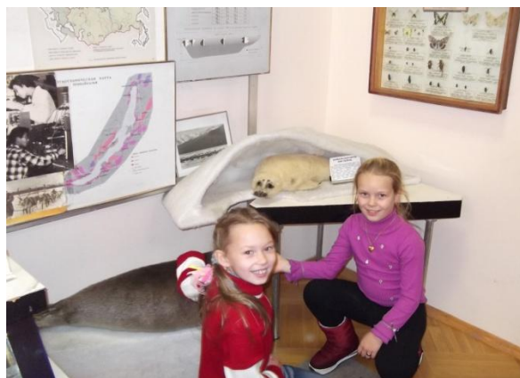
Рис. 6. Нерпа

Байкал дарит нам великую радость и огромное наслаждение. Он поражает монументальностью стиля, тем прекрасным, могучим и вечным, что заложено в его природе. Он обладает замечатель-