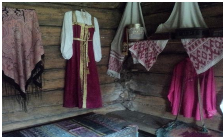
Рис. 2. Одежда и быт людей

В архитектурно-этнографическом музее «Тальцы» ребята познакомились с особенностями быта русских крестьян, с интересом рассматривали старинную посуду, избы, одежду. Внимательно слушали экскурсовода и задавали ему вопросы (рис. 2).