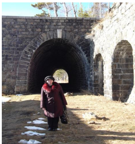
Рис. 3. Старый тоннель

В этом походе участвовало 15 туристов-краеведов и руководитель О.М.Ушакова. Путешествуя по Байкалу, мы всё больше увлекались возможностью поближе познакомиться с красотой родного края, сделать запоминающие фотоснимки, записать интересные фак-